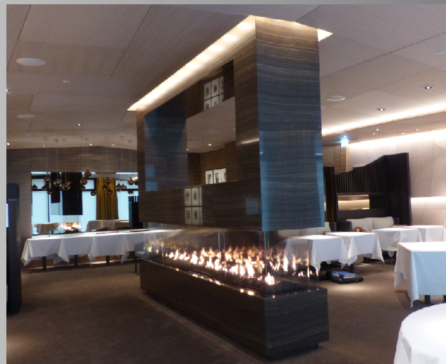
Abb. 2: Ausführungsbeispiel in einem Restaurant

Aber auch in großzügigem privaten Ambiente bietet sich der Kamin mit seinem Solitär-Charakter als raumgestalterischer Mittelpunkt an.